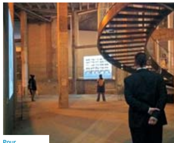
Pour l'essentiel, les services publics se font sur le terrain, du musée à la classe, de la caserne à l'hôpital.

En temps normal, le télétravail dans la fonction publique est un dispositif encadré, une méthode d'organisation d'un travail salarié, pas un travail à domicile. Localisation des lieux et équipements proposés, règles à respecter, protection des données, temps de travail, doivent être formalisés par l'administration. Et bien